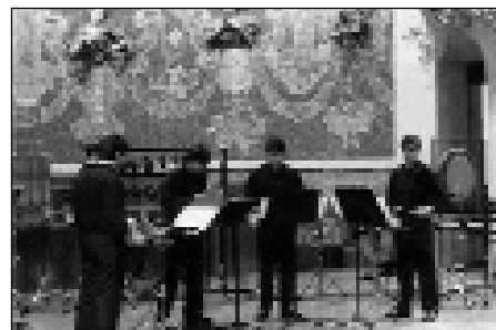
Percussions de Barcelona